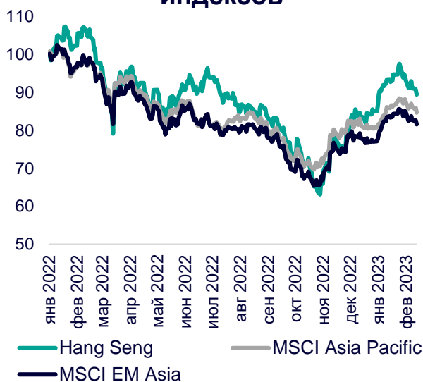
Динамика мировых индексов