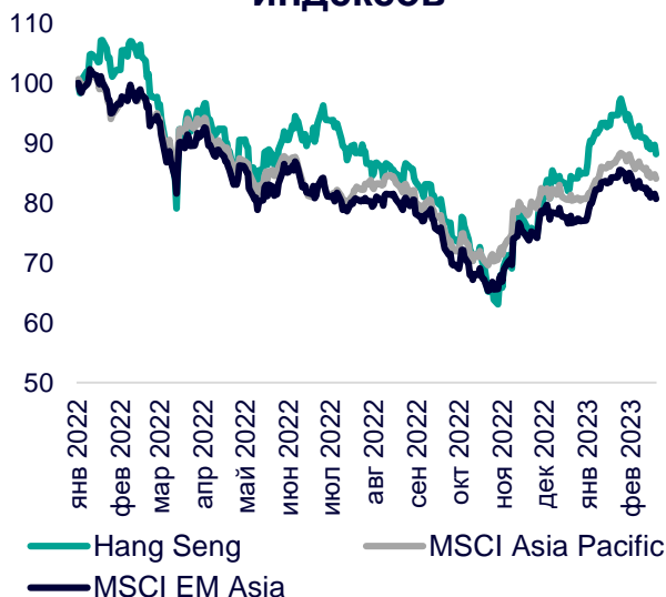
Динамика мировых индексов