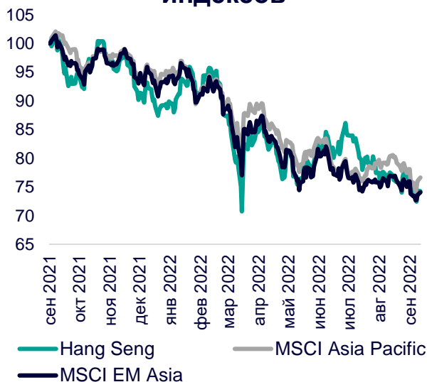
Динамика мировых индексов