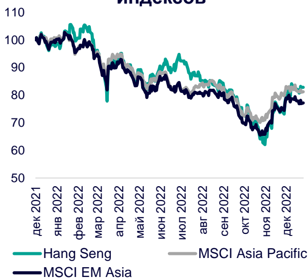
Динамика мировых индексов