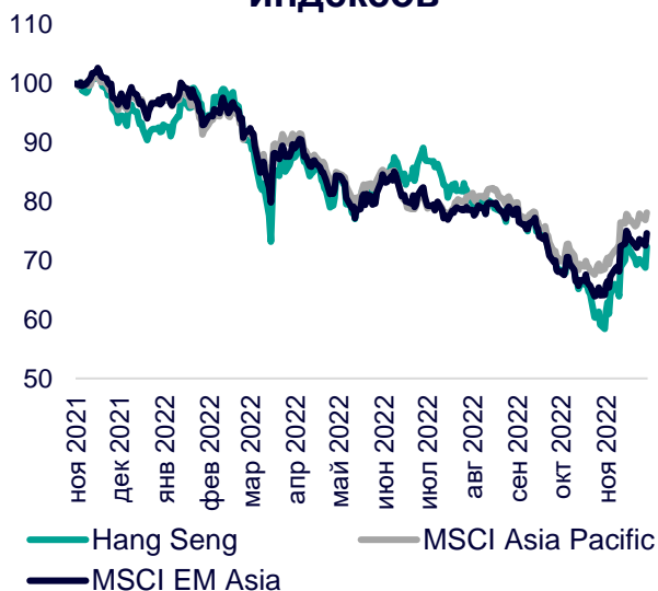
Динамика мировых индексов