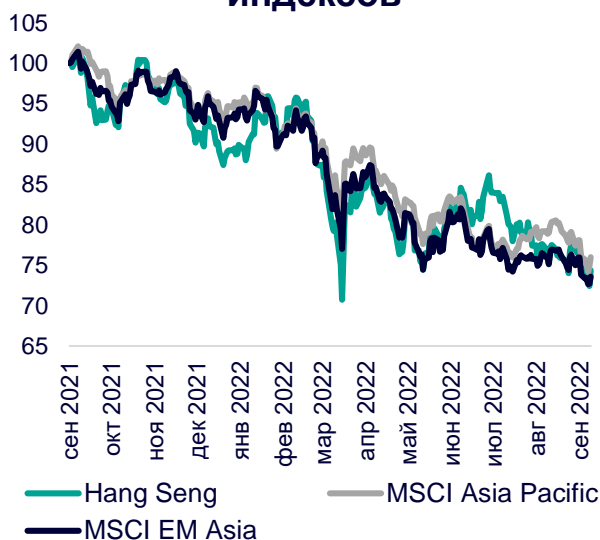
Динамика мировых индексов