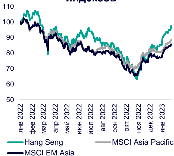
Динамика мировых индексов