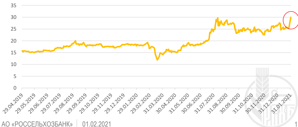
Стоимость серебра, $ (Mar21)

Рекордно низкие процентные ставки в сочетании с рынком акций США на историческом максимуме провоцируют излишние спекуляции на различных классах активов. Однако в отличие от предыдущих «маний» на рынке, в этот раз создается впечатление, что поколение миллениалов начало всерьез беспокоиться из-за бесконтрольного печатания денег центральными банками.