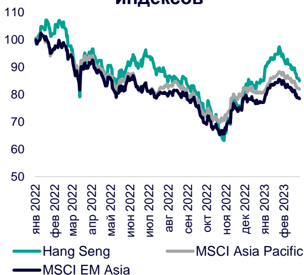
Динамика мировых индексов