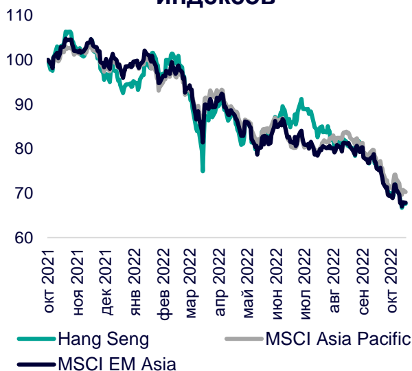
Динамика мировых индексов