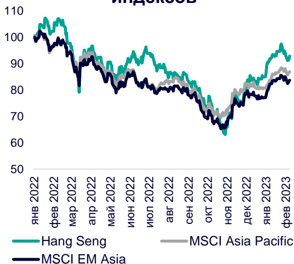
Динамика мировых индексов