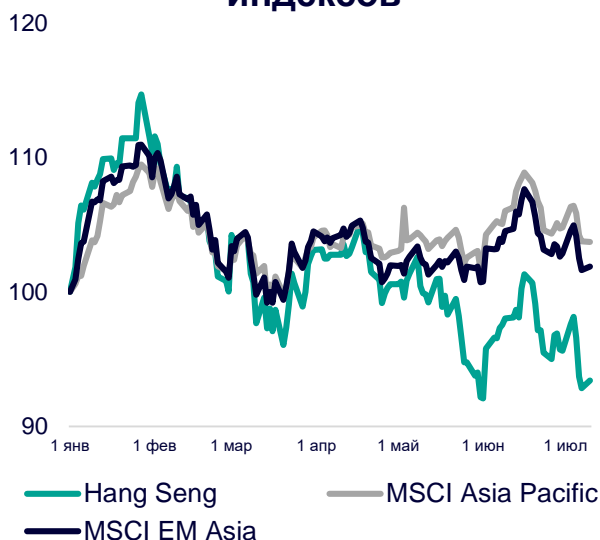
Динамика мировых индексов