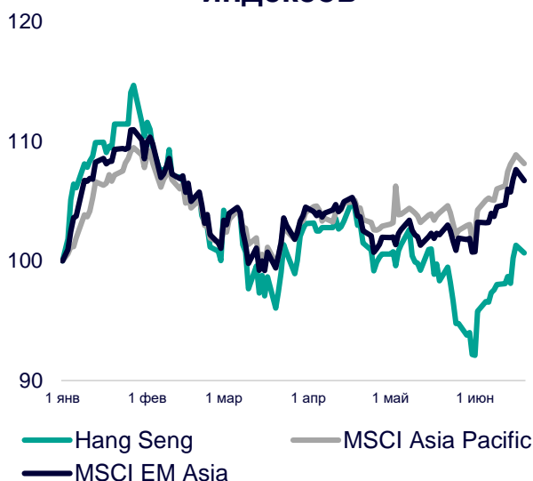
Динамика мировых индексов