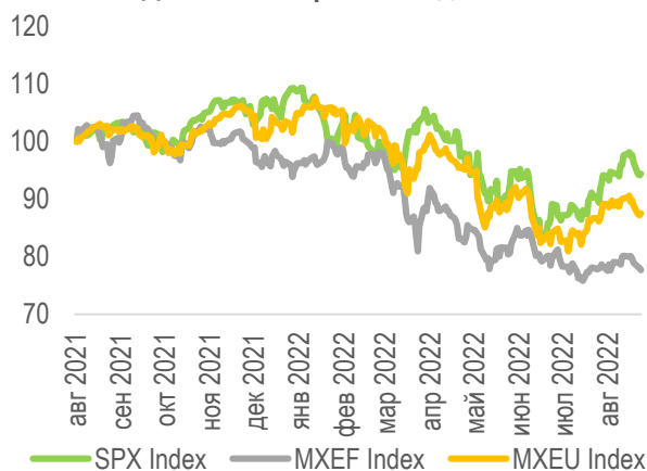
Динамика американских индексов