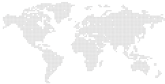
Динамика мировых индексов

Европейские площадки открыли торги ростом: Euro Stoxx набирает 0,64%, CAC – 0,57%, DAX – 0,70%. ВВП Германии во II кв. 2022 г. вырос на 0,1% м/м или на 1,8% г/г при прогнозе в 0,0% и 1,5%, соответственно. Деловой климат в стране в августе превысил ожидания аналитиков, составив 80,3 п. (-0,1 п. м/м), хотя в докладе немецкого института экономических исследований отмечается, что среди компаний неопределенность остаётся высокой, а в ближайшем квартале следует ожидать снижения объёмов производства в экономике.