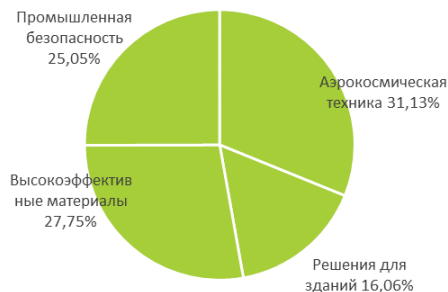
Структура выручки в 1 кв.2021

Что касается, ESG целей, то компания подтвердила свое намерение снизить выбросы углекислого газа к 2024 году на 10% по сравнению с 2018 годом, а к 2035 году достигнуть углеродной нейтральности.