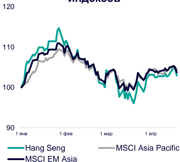
Динамика мировых индексов